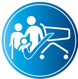
EL 212 BEN'S CART Einkaufswagen mit Sitz und Sicherheitsgurt