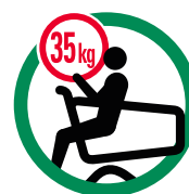
Kind in den Wagen setzen